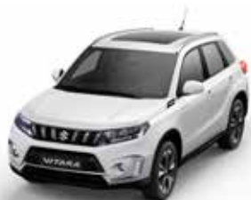
S White solid (26U)