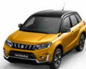
T Solar Yellow pearl metallic (DBH)