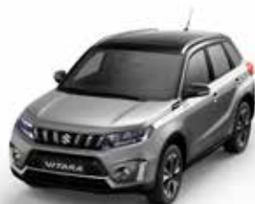
T Galactic Gray metallic (A9G)