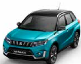
T Atlantis Turquoise metallic (A9L)