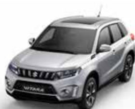
T Silky Silver 2 metallic (ZCC)