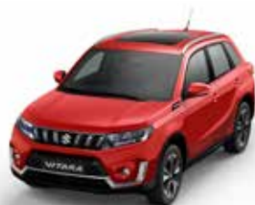
S Bright Red 5 solid (ZCF)