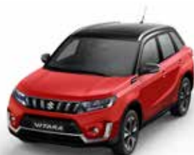
T Bright Red 5 solid (A9H)