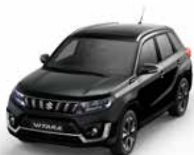
T Cosmic Black pearl metallic (ZCE)